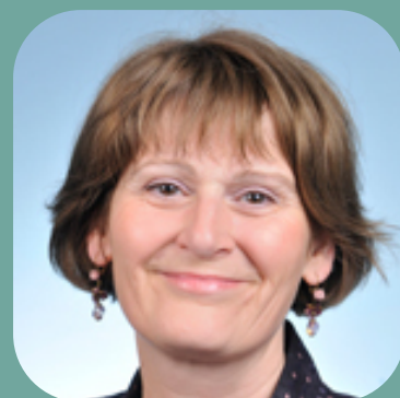
Françoise Descamps -Crosnier Présidente du FIPHFP