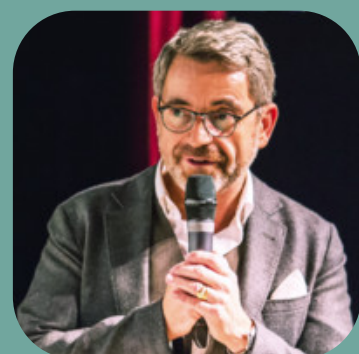
Animation : Charles Myara