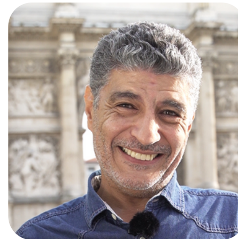
Adda Abdelli Auteur et comédien de la série Vestiaires