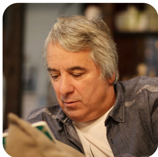
Georges Grard Auteur